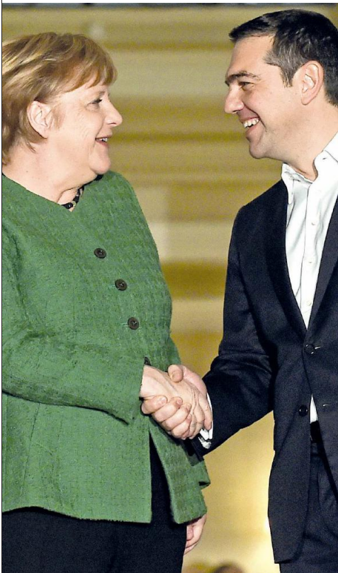
Angela Merkel e Alexis Tsipras ad Atene

La cancelliera ad Atene dopo cinque anni