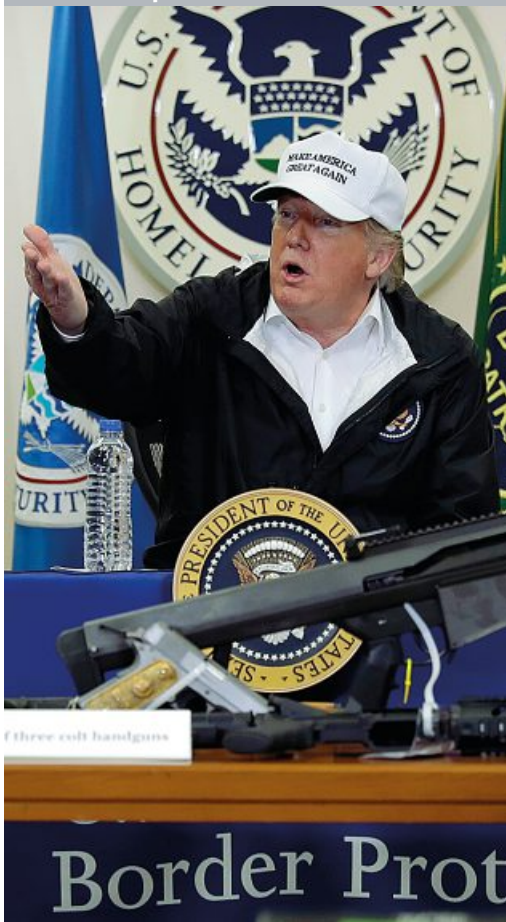
Il presidente Trump durante un dibattito sulla questione degli immigrati clandestini