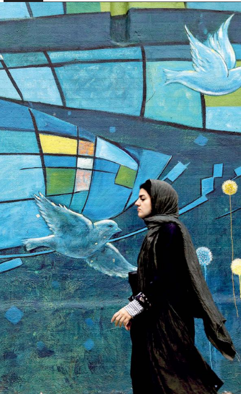
Teheran, donna passeggia davanti a un murale