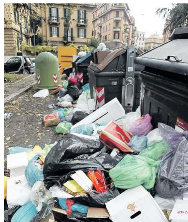
Rifiuti accatastati in piazza Trento a Roma

Camion in ritardo: è un flop il piano di Natale