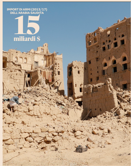
Traffico d'armi. In quasi quattro anni di guerra con l'Arabia Saudita sono più di 10 mila i morti nello Yemen (Fonti Onu)