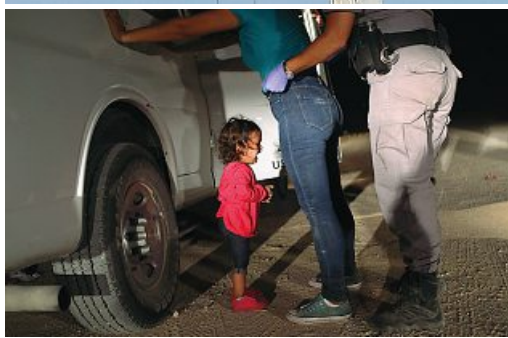
Il ponte Morandi a Genova. Sotto, a 2 anni in lacrime mentre arrestano la madre al confine tra Messico e Usa

2019 Immagini Un anno di volti e storie Quel che non dimenticheremo di Bruno Delfino STATI UNITI CONTRO CINA La sfida che ci cambierà di Massimo Gaggi a pagina 23 IL FILOSOFO BRUCKNER «Il sapere ora è il nemico» di Stefano Montefiori a pagina 22