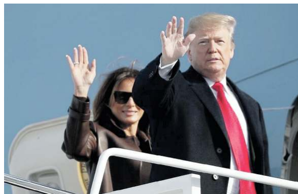
Donald Trump e Melania si imbarcano sull'Air Force One diretto in Argentina

L'incontro era previsto oggi durante il G20 di Buenos Aires