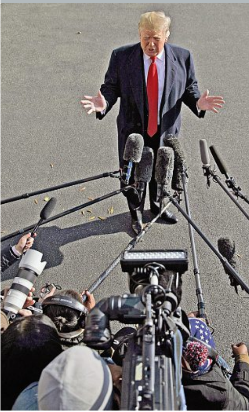
Il presidente americano Donald Trump (72 anni) risponde ai giornalisti prima di partire per il G20