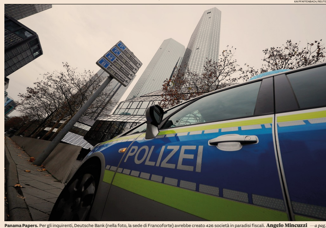
Panama Papers. Per gli inquirenti, Deutsche Bank (nella foto, la sede di Francoforte) avrebbe creato 426 società in paradisi fiscali. Angelo Mincuzzi — a pag. 5