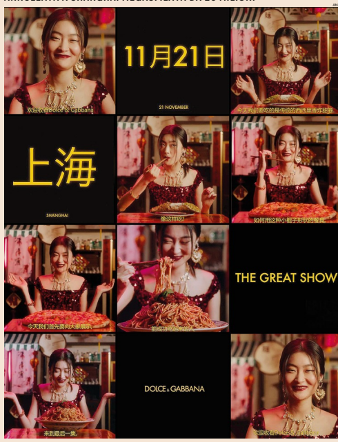
Dolce&Gabbana. Lo spot nel mirino. Al centro l'immagine più discussa con la didascalia: «Forse è troppo grande per te»