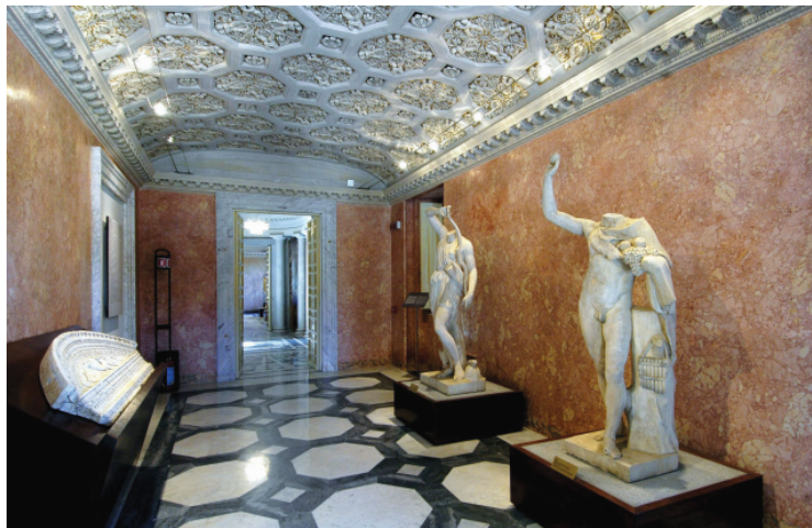
Il Casino Nobile di Villa Torlonia. La più grande collezione d'arte privata del mondo al centro della contesa dei 4 eredi