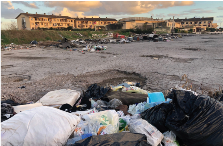
Il degrado ad Ardea: una discarica a cielo aperto vicina alle abitazioni GIOVANNINI, ROSSI E IL REPORTAGE DI ZANCAN — PP. 10-11