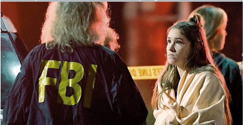
I primi soccorsi ai sopravvissuti alla strage di Thousand Oaks, in California, che ha provocato la morte di 12 persone e il suicidio dell'aggressore

California Sparatoria in un bar: dodici le vittime, poi il giovane si è tolto la vita