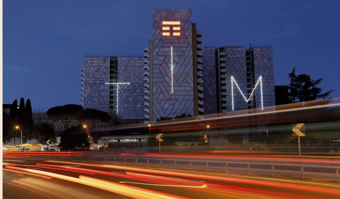
I conti del gruppo. I cda rettifica gli attivi italiani per 2 miliardi: sui 9 mesi 800 milioni di perdite