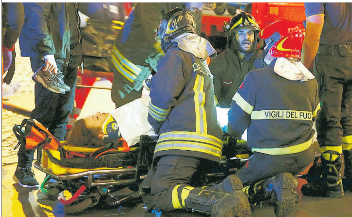
I primi soccorsi alla fermata Repubblica della linea A della metropolitana di Roma

Roma, terrore nel metrò: crolla la scala mobile Feriti 24 tifosi russi: "Saltavano". "No, è caduta"