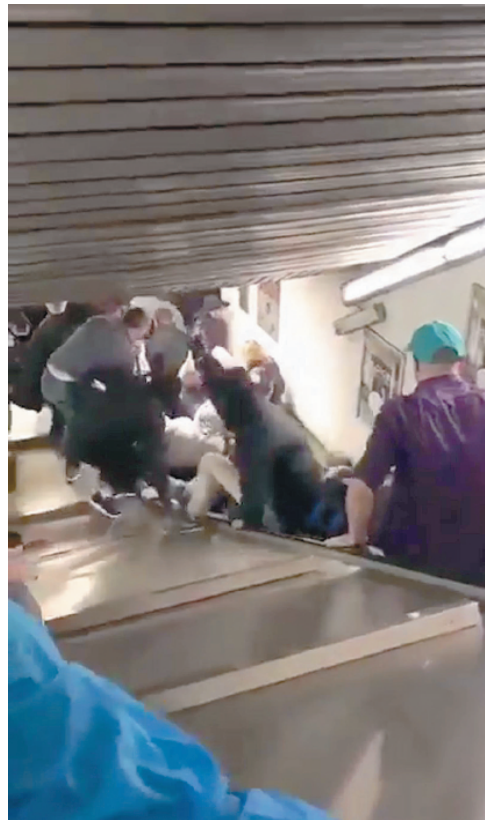
Il momento del crollo della scala mobile CORBI, IZZO E MOSELLO — P. 14-15