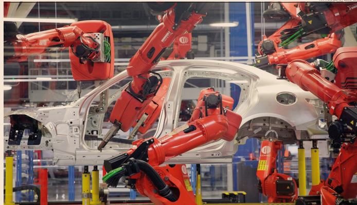
Pesa la debolezza in Italia. A spingere verso il basso le medie della manifattura è in particolare il comparto auto, settore che delude le attese