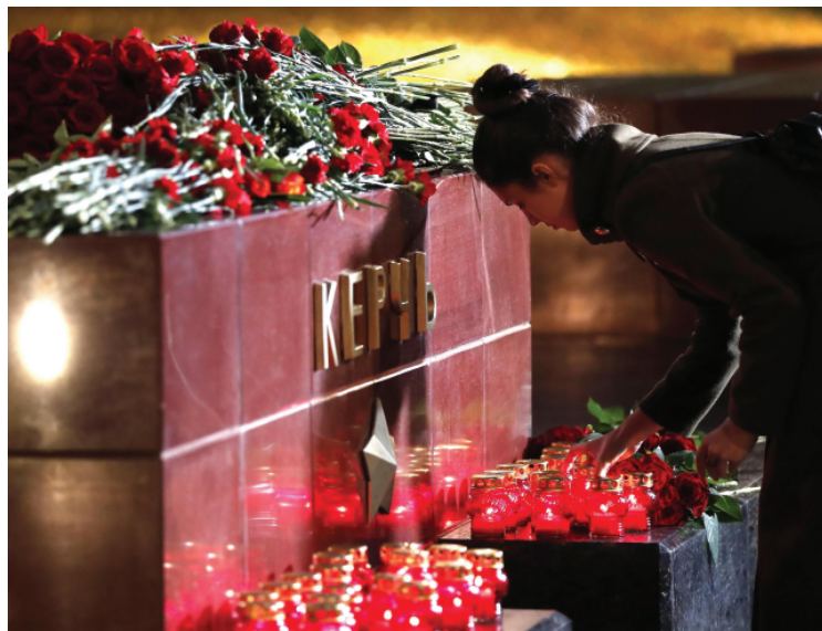
Kerch, fiori e lumini per le 19 vittime del 18enne che ha aperto il fuoco sui compagni e poi si è ucciso SERVIZIO — P. 10