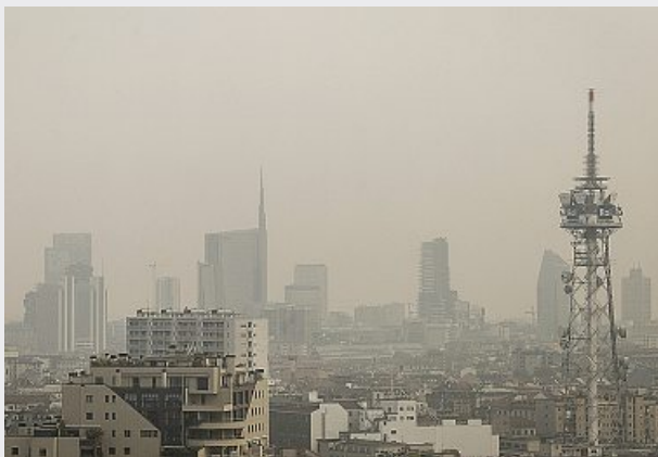
Il fumo offusca ancora il cielo di Milano dopo l'incendio del capannone pieno di rifiuti alla Bovisasca, a Nord della città

Lo stop della Cina ai rifiuti stranieri ha fatto saltare il sistema. E così la plastica è un'emergenza. a pagina 13