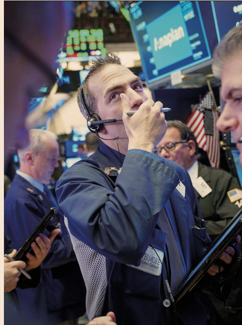
New York sugli scudi. Il Nasdaq, da un investitore europeo, risulta il miglior mercato del 2018 con un +15,44%