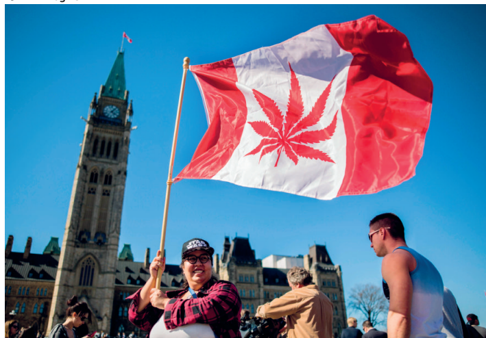
In Canada è stato fatto il primo acquisto legale di cannabis