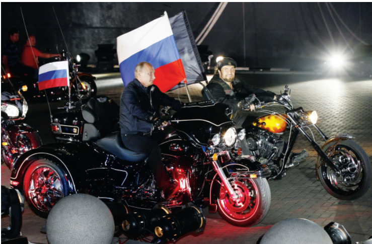
Le bande di biker vicini al Cremlino hanno aperto una base in Slovacchia AGLIASTRO E MASTROLILLI — P. 10