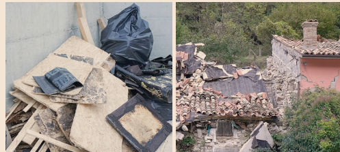
Territorio dimenticato. Sopra, nella foto grande: a Visso (Macerata) 49 casette hanno bisogno di lavori per la muffa e i residenti stanno uscendo dalle abitazioni. Sotto a sinistra: pezzi di cartongesso già rimossi dalle casette di Visso; a destra: casa distrutta a Castelsantangelo sul Nera (Macerata), dove tutto è bloccato a due anni fa