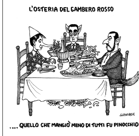
... QUELLO CHE MANGIÒ MENO DI TUTTI FU PINOCCHIO

La manovra non cambia. Ma l'Italia è disposta a trattare con l'Europa. Questa la risposta alla lettera di Bruxelles. E Conte incontrerà Merkel e Juncker.