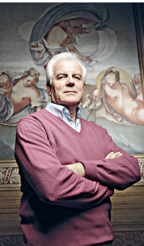
Gilberto Benetton, tra i fondatori dell'omonimo gruppo