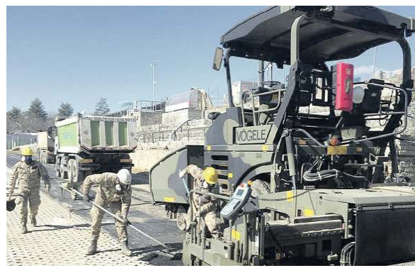
Il Genio militare dell'esercito impegnato in un cantiere stradale

I soldati asfalteranno 200 chilometri di strade capitoline. Il Comune fornirà il bitume per le riparazioni