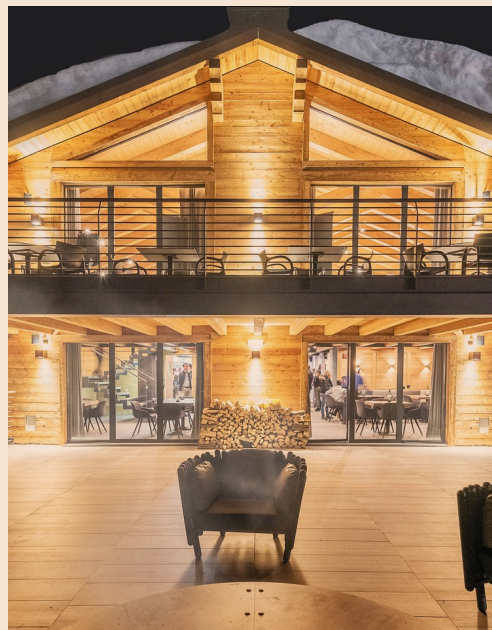
In vendita. Castello Sgr amministra asset per 2,5 miliardi (nella foto, lo chalet "Loge du Massif" di Courmayeur)