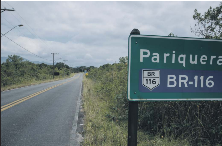
Brasile, la strada che collega l'imbarcadero all'isola di Cananeia, dove Battisti viveva da anni