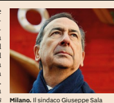
Milano. Il sindaco Giuseppe Sala

Qualità della vita 2018: vince Milano. Il sindaco, Giuseppe Sala, si dice «molto felice» per il risultato ma guarda avanti: «La vera sfida - spiega al Sole 24 Ore - si giocherà fuori dal nostro Paese, perché Milano dovrà essere in grado di confrontarsi con le grandi capitali internazionali. Per questo il lavoro da fare è ancora molto».