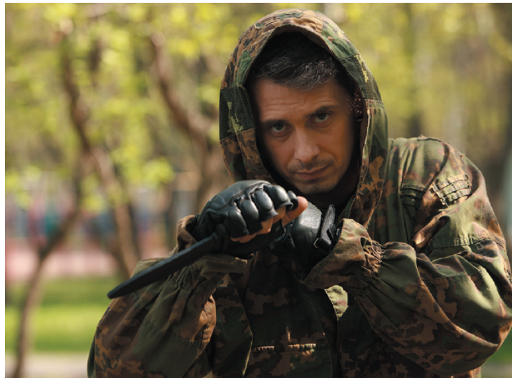
L'ex ufficiale delle forze speciali russe, Denis Yuryevich Ryazov, durante un addestramento: sottoposto a sanzioni individuali dal dipartimento di Stato Usa, oggi insegna arti marziali e ha visitato più volte l'Italia. MASTROLILLI — P. 9