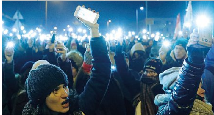
I manifestanti che a Budapest hanno protestato contro la decisione del governo Orbán di aumentare le ore di straordinario

Proteste in piazza Manca manodopera, scatta l'obbligo degli straordinari