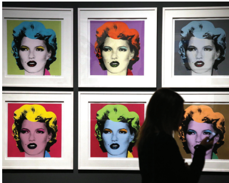
Kate Moss (2005), una delle opere di Banksy in mostra al Museo delle culture di Milano