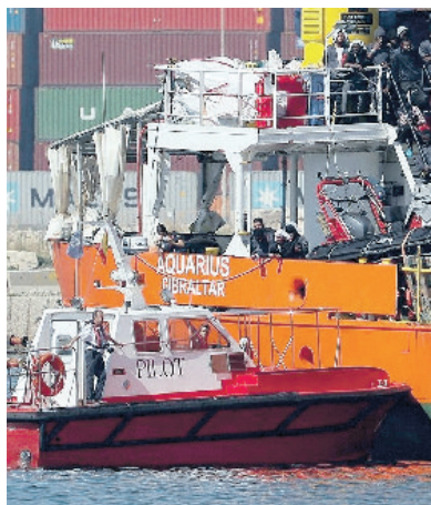
La nave "Aquarius" è stata fermata dalla Procura

Indagata Msf per le scorie dopo gli sbarchi