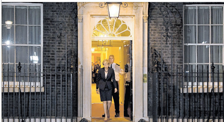
La premier britannica Theresa May esce da Downing Street dopo la riunione di governo su Brexit