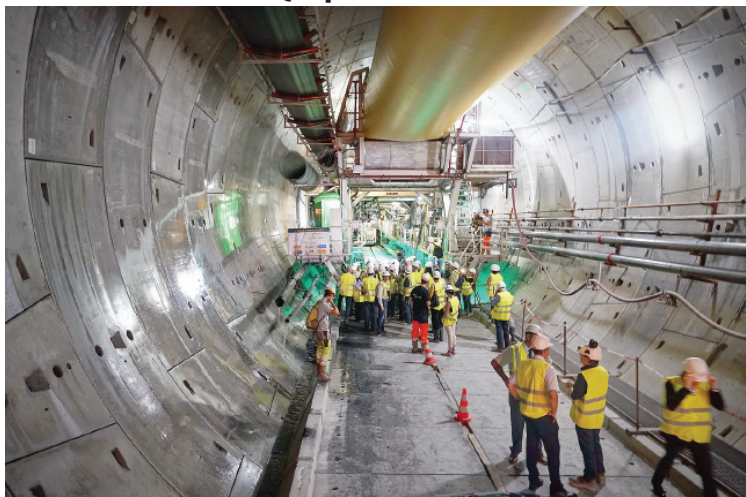
Lavoratori nel tunnel della Tav tra Saint-Martin-La-Porte e La Praz, nella Savoia francese LILLO, ROSSI E TROPEANO — P. 13