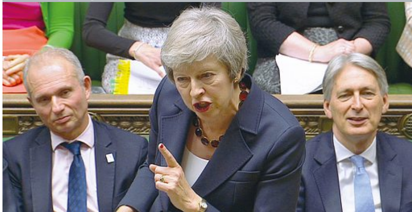
Il primo ministro britannico Theresa May, 62 anni, agita l'indice mentre risponde alle domande sulla Brexit alla Camera dei Comuni