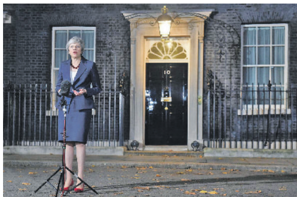
Theresa May annuncia l'appoggio del governo sull'accordo per la Brexit

Via libera del governo. Vertice straordinario a Bruxelles il 25