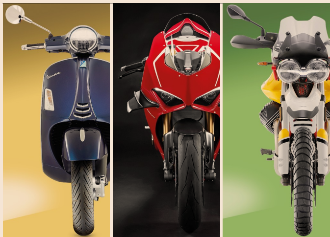
Le novità in vetrina all'Elcoma di Milano. Da sinistra la Vespa Gts 300, la Ducati Panigale V4R da 234 cavalli e il crossover Guzzi Ves TT