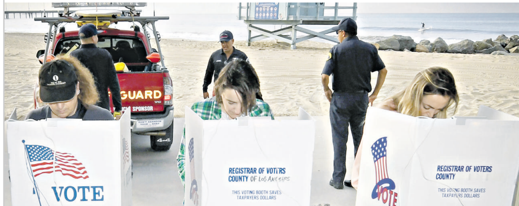
Gli americani votano alle elezioni di metà mandato. Nella foto, un seggio sulla spiaggia a Los Angeles, California

Midterm, lunghe file ai seggi per il "referendum" sul Presidente