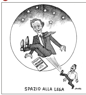
SPAZIO ALLA LEGA