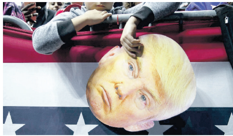
Un fan di Donald Trump in attesa del comizio del presidente Usa a Fort Wayne, in Indiana

Elezioni di Midterm. Democratici favoriti per la conquista della Camera, non del Senato