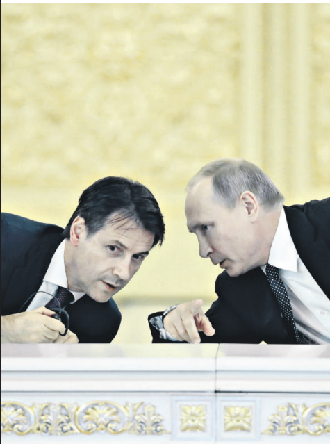
Giuseppe Conte e Vladimir Putin a Mosca