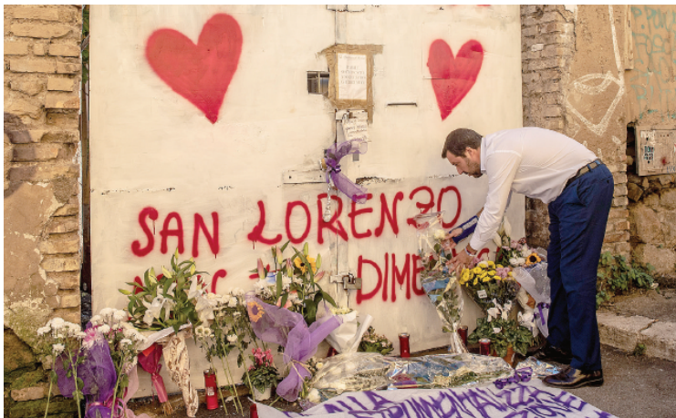
Salvini depone una rosa bianca all'entrata del palazzo dove è stata stuprata e uccisa la sedicenne, nel quartiere San Lorenzo: accolto da applausi e da qualche contestatore. LA MATTINA, LONGO, PERINA, TOMASELLO E SORGI — PP. 8-9