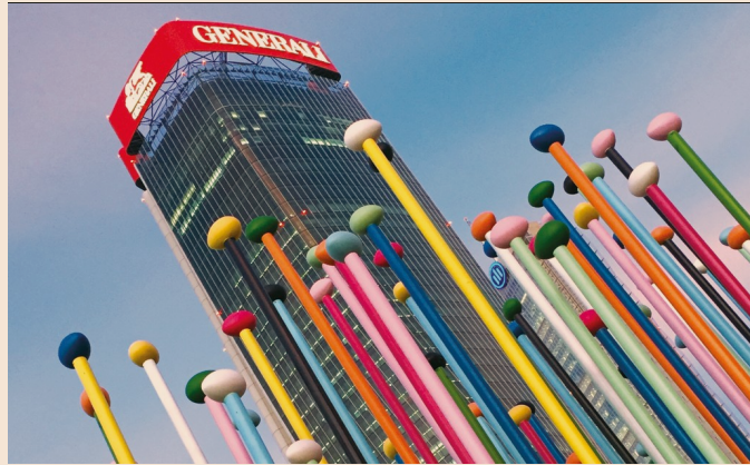
Il riassetto del Leone di Trieste. La cordata tricolore sale oltre il 25% del capitale