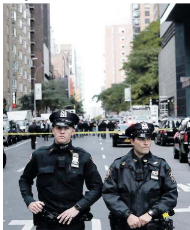
New York, controlli dopo l'allarme bomba alla Time Warner

Recapitati alla Cnn, a Obama e alla Clinton