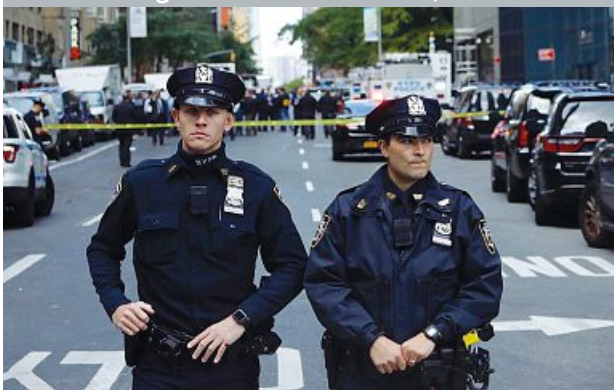
La polizia chiude la strada dopo l'allarme bomba negli uffici della Time Warner a New York, dove si trova la sede della Cnn

In America Tra gli obiettivi Clinton e Obama, Cnn evacuata