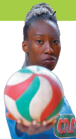
Paola Egonu, 19 anni