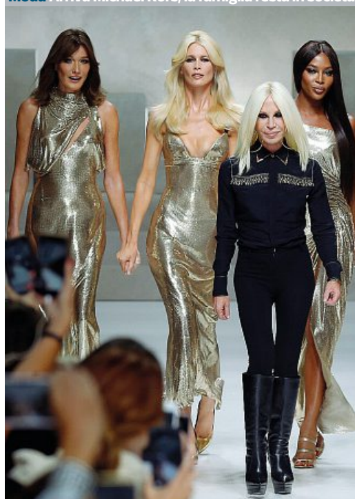
Donatella Versace sfilava con le top model Carla Bruni, Claudia Schiffer e Naomi Campbell

Moda Arriva Michael Kors, la famiglia resta in società