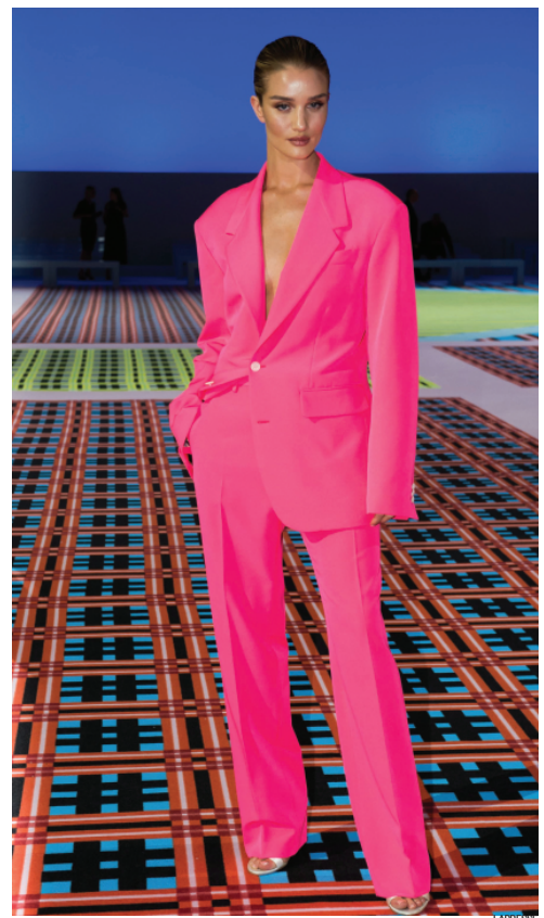
Rosie Huntington-Whiteley sfila per Versace alla Fashion Week di Milano RIGATELLI E SPINI — PP. 26-27