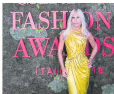
BRAND Donatella Versace alla Milano Fashion Week

Il colosso passa nelle mani Usa, Donatella resterà in società